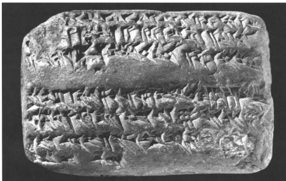
شکل ۲: پشت گل نوشته