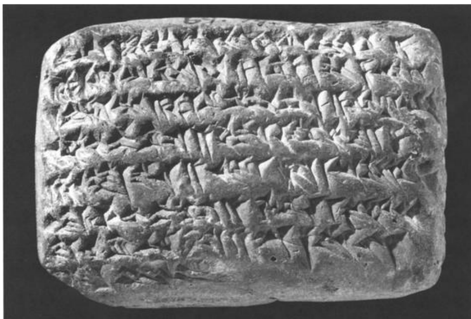
شکل ۱: روی گِل‌نوشته

اصلی آن مشخص نشده است. ظاهراً، بیل-ایدین مُرده بود و همسرش با پرداختِ بدهی‌هایی، که او در طول زندگی به بار آورده، روبه‌رو بود. سند هیچ اشاره‌ای به مبلغ اضافی نقره برای بازپرداخت در آینده نکرده است؛ بنابراین به نظر می‌رسد که اکنون تمام بدهی تسویه شده است. رسید پرداخت در دو نسخه صادر شده است؛ یکی برای بدهکار (پیشین) به عنوان مدرک پرداخت و دیگری برای بستانکار (پیشین) برای کارهای محاسباتی [تجارت‌خانه]. هیچ شکی نیست که این گِل‌نوشته متعلق به طلبکار است، چراکه از بایگانی او (وام‌دهنده) است که [تا کنون] هزاران گِل‌نوشته به دست ما رسیده، در حالی که هیچ لوحی از [جانب] وام‌گیرنده باقی نمانده است.